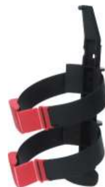
Soporte de transporte